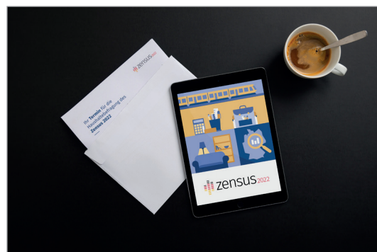
© Statistische Ämter des Bundes und der Länder, 2021

Die Statistischen Ämter sind auch darauf eingestellt, einen Fragebogen auf Papier bereitzustellen, sollte eine Online-Meldung nicht möglich sein. Eine Rücksendung der ausgefüllten Fragebogen ist in diesem Fall portofrei möglich. Die eingesetzten Papierfragebogen werden klimaneutral und auf zertifiziertem Papier gedruckt. Der postalische Versand erfolgt ebenfalls klimafreundlich.