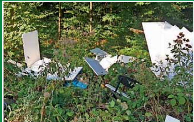
Thomas Breig Bürgermeister