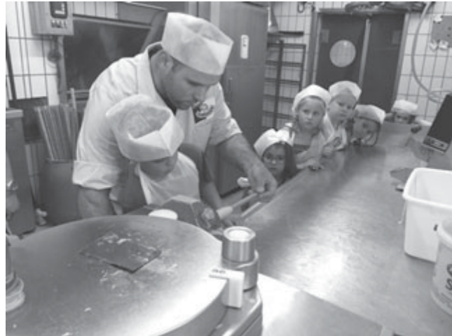
Die Kinder und Erzieherinnen von der Kindertagesstätte „St. Martin“

gaben. Es war sehr eindrucksvoll und interessant und wenn die Kinder das nächste Mal in ein Wienerle beißen, dann wissen sie ganz genau wie es gemacht wurde!